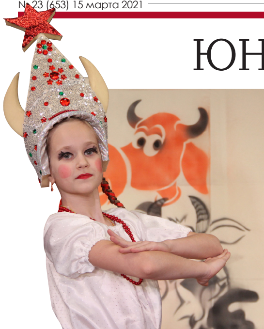
Сцена из спектакля «Буренушка». Театральная студия «Зеленое небо».

Марина КОЗЛОВА, фото предоставлены организаторами