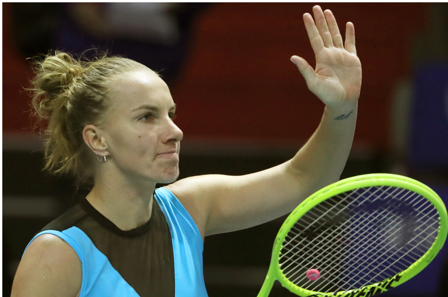
Александр ДЕМЬЯНЧУК / ТАСС