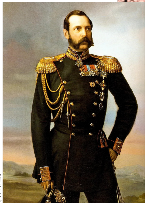
Парадный портрет Александра II.

В тех исторических условиях, в которых государство оказалось к середине XIX века, было практически невозможно сохранить прежний международный статус, не отказавшись от феодальных пережитков. Экономика страны требовала серьезных изменений, которые в конечном счете и произошли благодаря либеральным реформам Александра II.