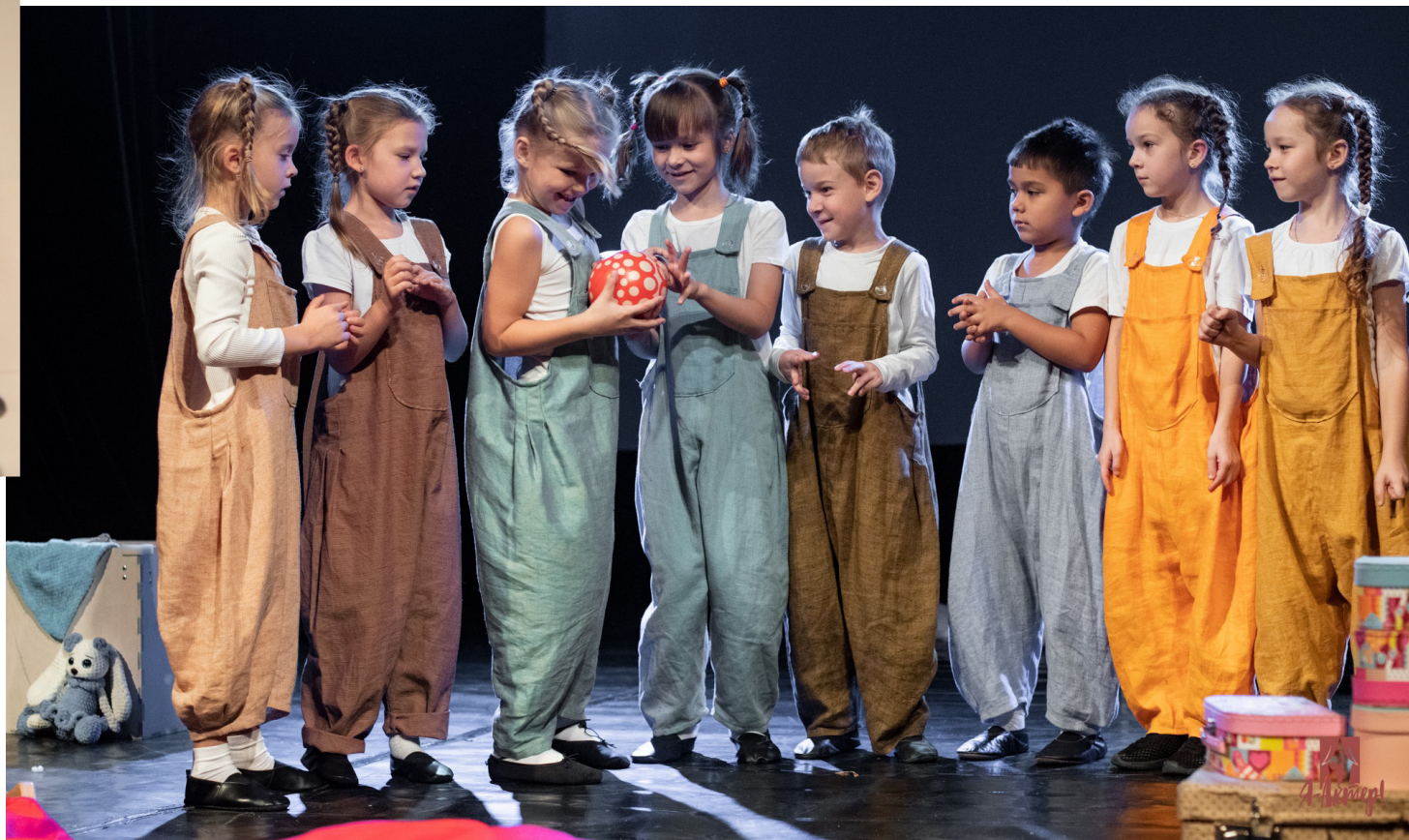
Сцена из спектакля «Мамина улыбка». Театральный коллектив «Браво».

С 15 по 18 марта в ТЮЗе им. А. А. Брянцева проходит XXII Международный Брянцевский фестиваль детских театральных коллективов. Театры-студии при школах, Дворцах творчества покажут свои лучшие работы на Малой сцене.