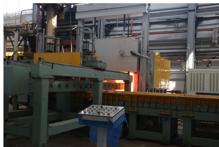
Экспериментальный прокатный стан «Кварто-800» на площадке «Прометей» в Гатчине позволяет создавать новейшие технологии для российской металлургии.

рия Васильевича материалы для сборника «По пути создания», посвященного итогам за последние пять – десять лет,